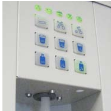
Silicon Rubber Keyboard mit LED hinterleuchtet